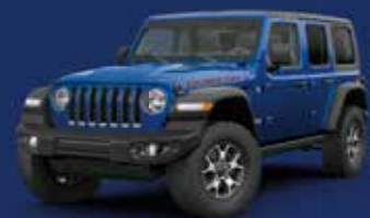
Ocean Blue Metallic