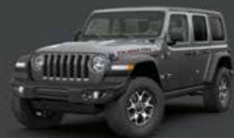
Granite Crystal Metallic