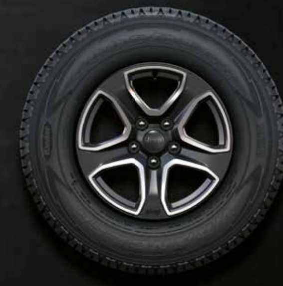
17" lichtmetalen velgen gepolijst Granite Crystal Niet leverbaar