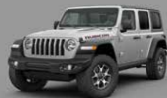
Billet Silver Metallic