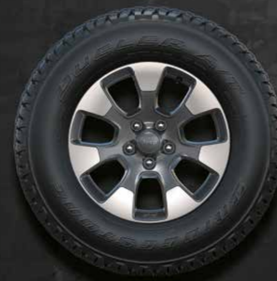
18" lichtmetalen velgen gepolijst, Tech Gray Onderdeel van Overland Pack op Sahara