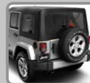
Sunrider® SoftTop (zwart)