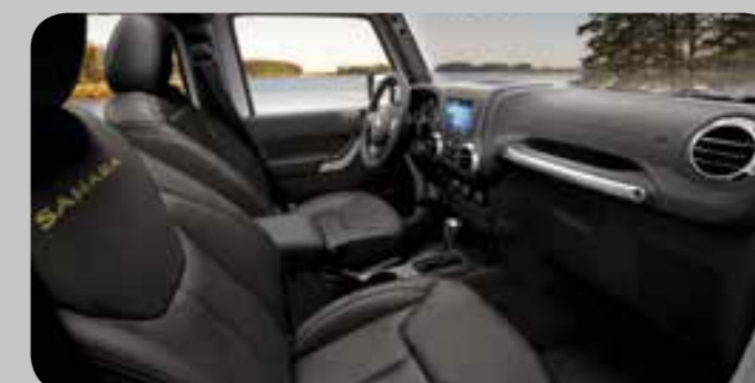
1AL McKinley — Black lederen bekleding met accentstiksels (Optioneel)