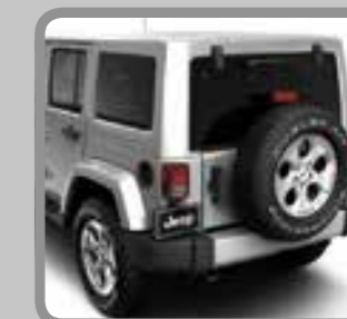
Freedom® HardTop (in carrosseriekleur)