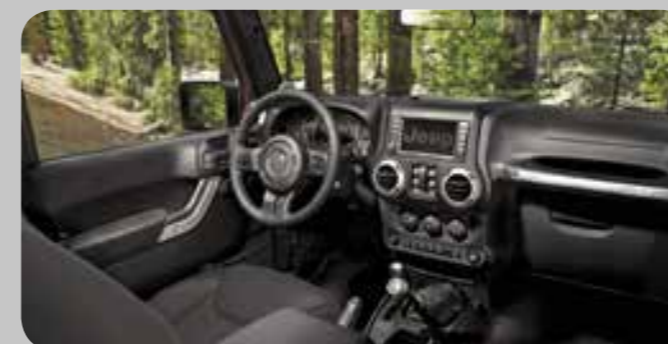
1A7 Sedosa/Rivet — Black stoffen bekleding met accentstiksels in Light Slate Gray