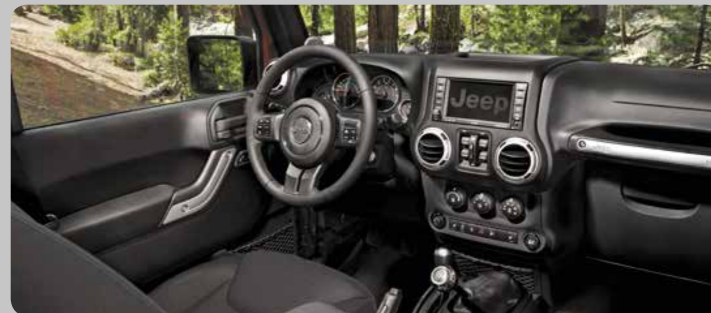
1A7 Sedosa/Rivet — Black stoffen bekleding met accentstiksels in Light Slate Gray