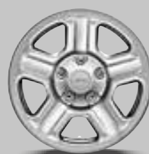
WLC 16-inch stalen velgen Standaard voor Sport