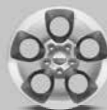
WFC 18-inch gepolijste lichtmetalen velgen Standaard voor Sahara