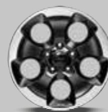
WK3 18-inch gepolijste lichtmetalen velgen Mineral Grey Standaard voor Rubicon