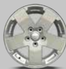
WK1 18-inch gepolijste lichtmetalen velgen Optioneel voor Sport