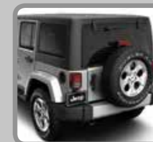
Freedom® HardTop (zwart)